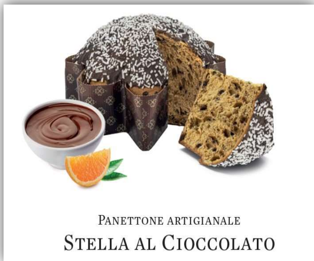
PANETTONE ARTIGIANALE STELLA AL CIOCCOLATO

PANETTONE ARTIGIANALE STELLA AL CIOCCOLATO arricchito da pasta d'arancio e gocce di cioccolato glassatura di cioccolato e granella di zucchero Palmisano 800 g