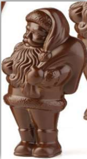
BABBO NATALE fondente/latte Raky 250 g