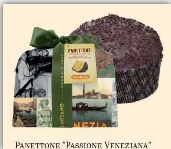
PANETTONE "PASSIONE VENEZIANA"

PANETTONE ARTIGIANALE "PASSIONE VENEZIANA" con deliziosi pezzi di morbida pera glassatura di cioccolato fondente con granella di biscotti veneziani Palmisano 750 g