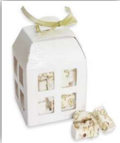
LANTERNA CON TORRONCINI Raky 200 g