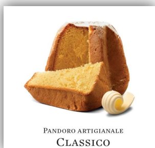
PANDORO ARTIGIANALE CLASSICO

PANDORO ARTIGIANALE arricchito da un tocco di zabaione Palmisano 750 g