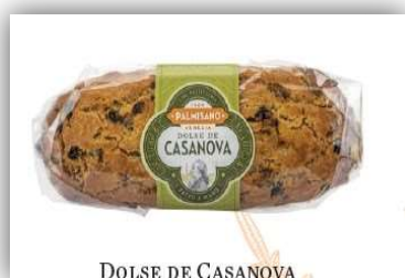
DOLSE DE CASANOVA