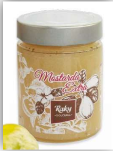
MOSTARDA EXTRA IN VASO Raky 400 g