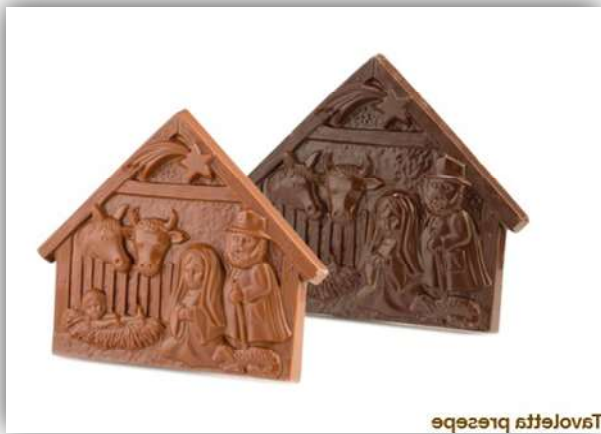
TAVOLETTA PRESEPE fondente/latte con scatola Raky 300 g