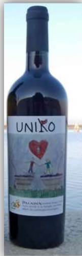
VINO UNIKO ROSSO uve Cabernet e Malbec 0,75 L Cantine Paladin