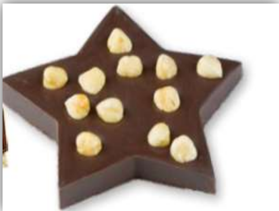
STELLA CON NOCCIOLE fondente/latte Raky 100 g