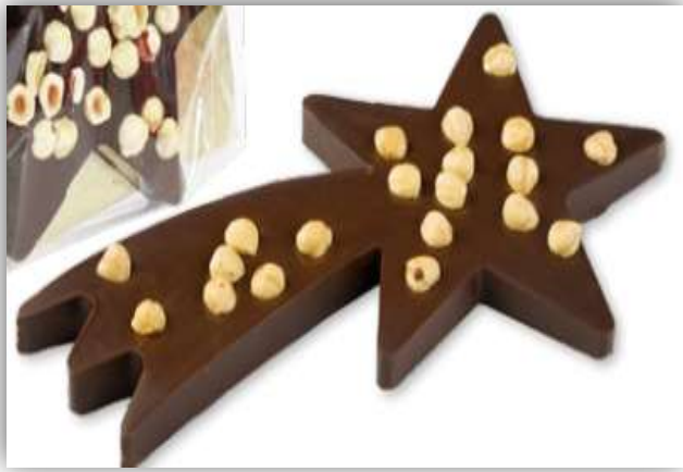
STELLA COMETA CON NOCCIOLE fondente/latte Raky 400 g