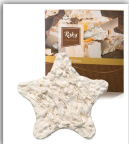
STELLA DI TORRONE Raky 350 g

Tutti i prodotti a Vostra scelta possono essere confezionati in una cesta natalizia con un piccolo contributo.