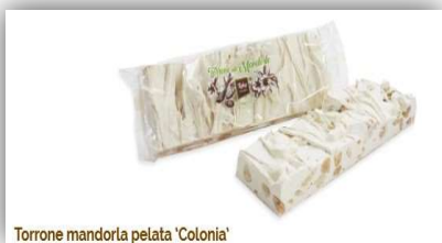
Torrone mandorla pelata 'Colonia'