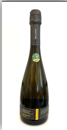
PROSECCO DOC MILLEMESIMATO EXTRA DRY 0,75 L Cantine Paladin