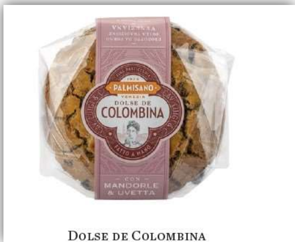
DOLSE DE COLOMBINA

DOLSE DE COLOMBINA con mandorle ed uvetta Palmisano 300 g